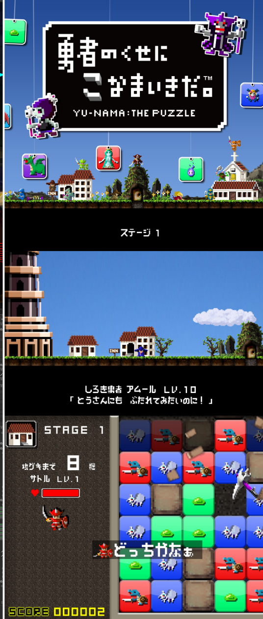
© 2013 Sony Computer Entertainment Inc.