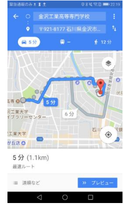
図2 スクリーンショット2