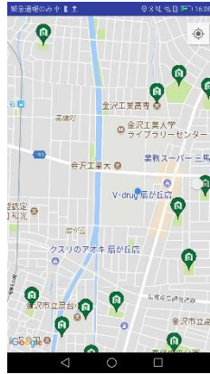
図1 スクリーンショット1