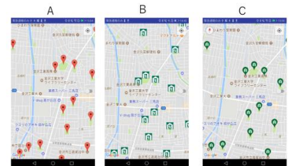
図4のアンケートは、避難所の位置を示すマーカーのデザインを決定するために行った。